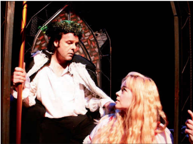
Szene aus „The Tempest“