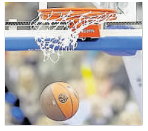
An zwei Tagen fallen in Oberursel viele Körbe.

ten Sporthallen des Gymnasiums Oberursel (Berliner Straße) um die beiden Trophäen gespielt. Im Vorjahresfinale hatten sich die Damen der HTG Bad Homburg dem BC Wiesbaden knapp geschlagen geben müssen.